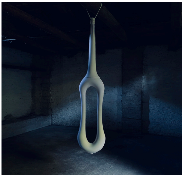
Ruth Amstutz, Installation au Grottino der Casa Sciarredo, ©Ruth Amstutz