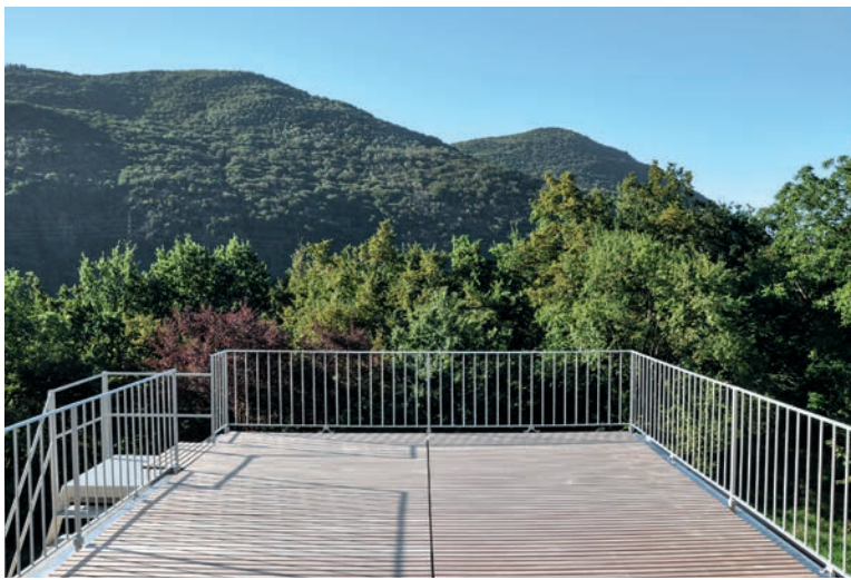
Auf dieser Dachterrasse verbrachte die Künstlerin Georgette Klein Tage und Nächte.