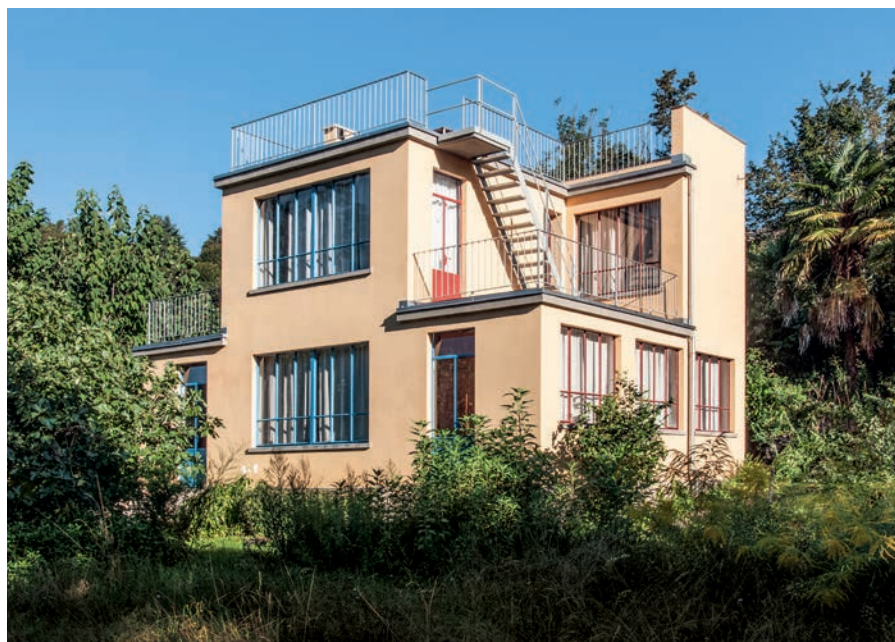
«Von oben nach unten entworfen»: das Künstlerhaus in Barbengo.