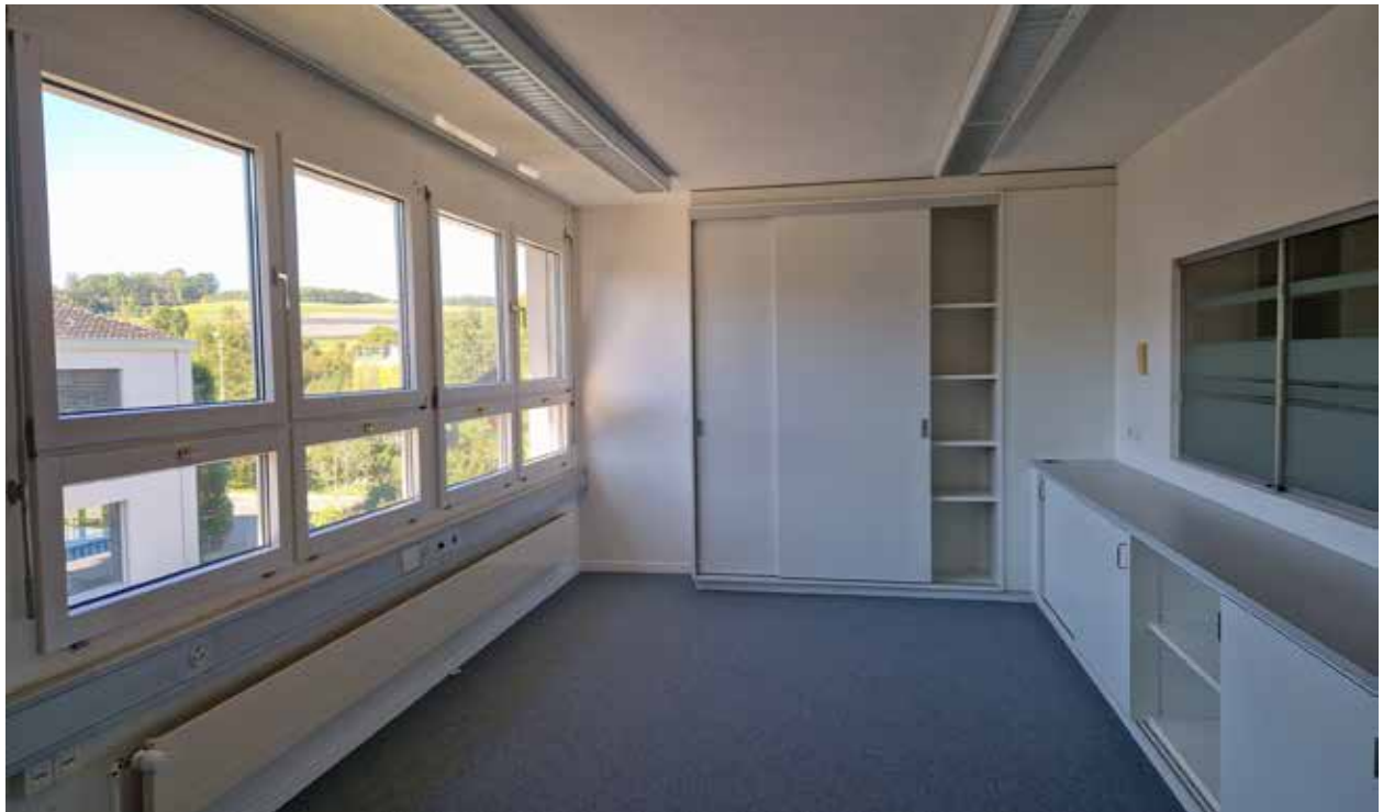
Büro / Empfang